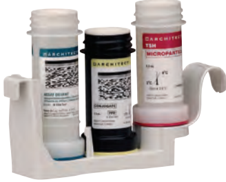
ARCHITECT i1000SR Reaktif Taşıyıcısı